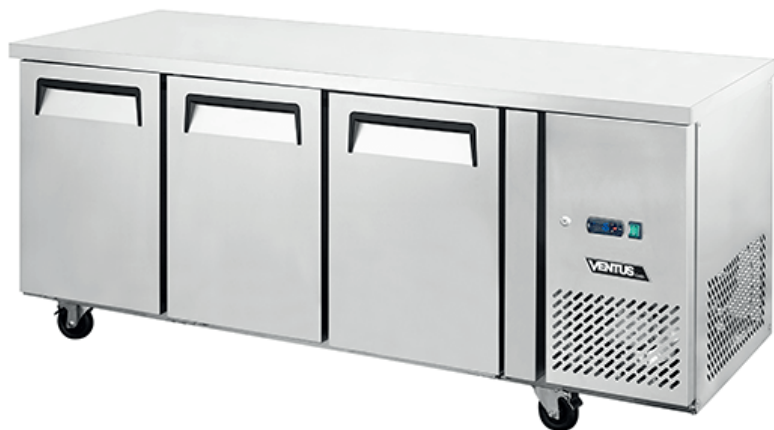
Controlador Digital Carel

Equipo ideal para preparación y refrigeración de productos